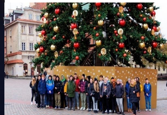
Mikołajkowy wyjazd klas IIb i IIc do Warszawy